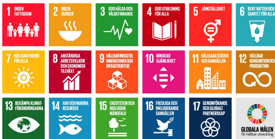
Figur 2. De 17 globala hållbarhetsmålen i Agenda 2030

År 2015 enades FN:s generalförsamling om en gemensam plan för en hållbar framtid genom att anta Agenda 2030 som innehåller 17 globala mål för hållbar utveckling. Målen ska vara vägledande för beslut såväl för FN som för alla medlemsnationer. Bakom beslutet ligger insikten om att vi idag är den första generationen som kan utrota fattigdomen, och sannolikt den sista som kan stoppa klimatförändringarna. Agendan bygger på idén om tre dimensioner av hållbar utveckling – den ekonomiska, den sociala och den ekologiska – som alla är beroende av varandra. De 17 globala målen (figur 2) med sammanlagt 169 delmål handlar om att bygga en mer rättvis och jämställd värld inom planetens gränser. De globala målen ska balansera och integrera de tre dimensionerna av hållbar utveckling. 59 I Sverige omhändertas den miljömässiga dimensionen av Agenda 2030 inom det svenska miljömålssystemet. 60