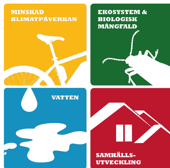
Figur 1. De fyra åtgärdsprogrammen som tillsammans omfattar åtgärder för länets prioriterade miljö- och samhällsutmaningar inom Färdplan för ett hållbart län.

En av rådets främsta uppgifter är att vara aktiv i framtagande och genomförande av åtgärdsprogrammen inom Färdplan för ett hållbart län. Rådet är också en viktig arena för fördjupad analys och samsyn kring länets miljö- och samhällsutmaningar. Medlemmar i rådet är kommuner, myndigheter och andra organisationer som genom sin verksamhet har