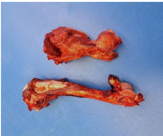
Figur 2. Gammal omlott-avläkt fraktur av höger överarmsben (överst). Höger överarmsben är 16 cm långt jämfört med vänster som är 24 cm.

Tre av vargarna hade lokala äldre avläkta skelettskador. Individ M531354 hade äldre revbensskador med benpålagringar på både höger och vänster sida. Individ M531355 hade en avläkt fraktur på höger överarmsben (figur 2) och varg M531359 påträffades ha en ovanlig skada i pannbenet (figur 3). Ingen varg hade äldre skottskador.