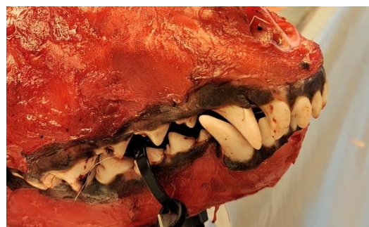
Figur 1. Överbett samt felplacerade hörntänder hos individ M531351.

Av de 19 undersökta hanarna hade tre missbildningen kryptorkism. I två av fallen låg ena testikeln kvar i buken och i det tredje fallet låg en av testiklarna i ljumsken. Några bifynd noterades hos enskilda individer; tre individer hade bettfel som överbett, underbett samt tångbett. Totalt hade 21 vargar noteringar på tandstatusen. En varg hade en mindre förkalkning i kroppspulsådern nära hjärtat och två individer hade lindriga förkalkningar i lungorna.