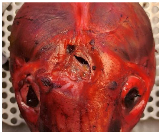
Figur 3. Äldre fraktur i pannben, med hål genom pannbenet in till näshålan.

Tre vargar noterades vid besiktning efter jakten ha hudförändringar tydande på rävskabb. Blodprovsanalyser visade att två av vargarna var eller hade varit angripna av skabb. Analyser för dvärgbandmask var inte färdiga vid denna rapportens publicering.