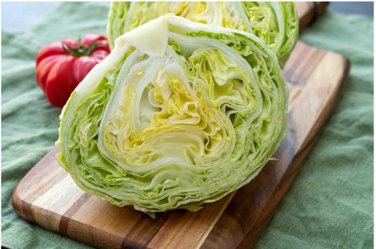
Figur 60: Yersinios hos människor anses huvudsakligen vara livsmedelsburna. Fläskkött är en känd riskfaktor, men även grönsaker bör betraktas som en potentiell smittkälla. Under 2023 kunde ett utbrott i Stockholms län kopplas till konsumtion av isbergssallat från Spanien.

Yersinios hos människa kännetecknas oftast av diarréer (främst Y. enterocolitica ), magsmärter (främst Y. pseudotuberculosis ) och ibland kräkningar. I vissa fall blir lymfknutorna i magen svullna och inflammerade (mesenteriell lymfadenit eller så kallad körtelbuk) vilket ger symptom som ibland misstas för blindtarmsinflammation.