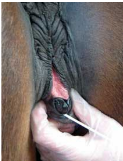
Provtagning från fossa clitoridis.

CEM-bakterien, Taylorella equigenitalis , kan ofta isoleras från sekretet som finns i den centrala sinus clitoridis.