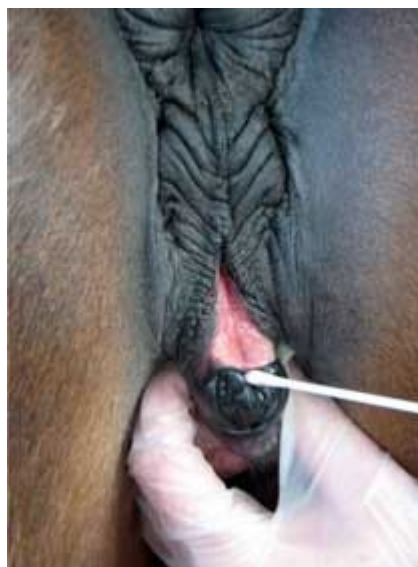
Provtagning från centrala sinus clitoridis.